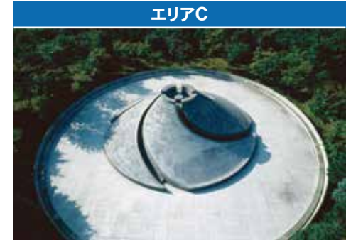
スライドマウンテン